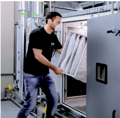
Die Betriebsmittelversorgung ist bei uns in besten Händen

ROM Technik bietet Ihnen genau die Lösung, die Sie brauchen. Dabei erfüllen wir zuverlässig die Vorgaben verschiedener Normen und Richtlinien für Wartungen an gebäudetechnischen Anlagen.