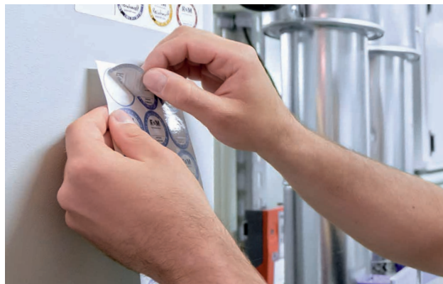
Wartungsarbeiten werden lückenlos dokumentiert und nachgewiesen