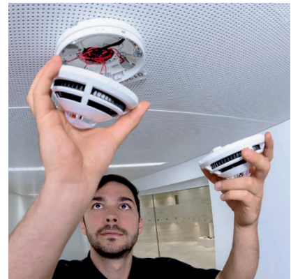
Überprüfen und Warten von sicherheitsrelevanter Technik, wie z. B. Rauchmelder