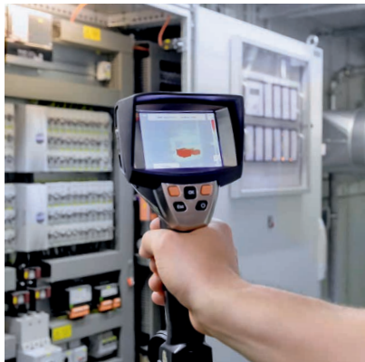
Wir verfügen über moderne Instrumente, wie z. B. die Wärmebildkamera